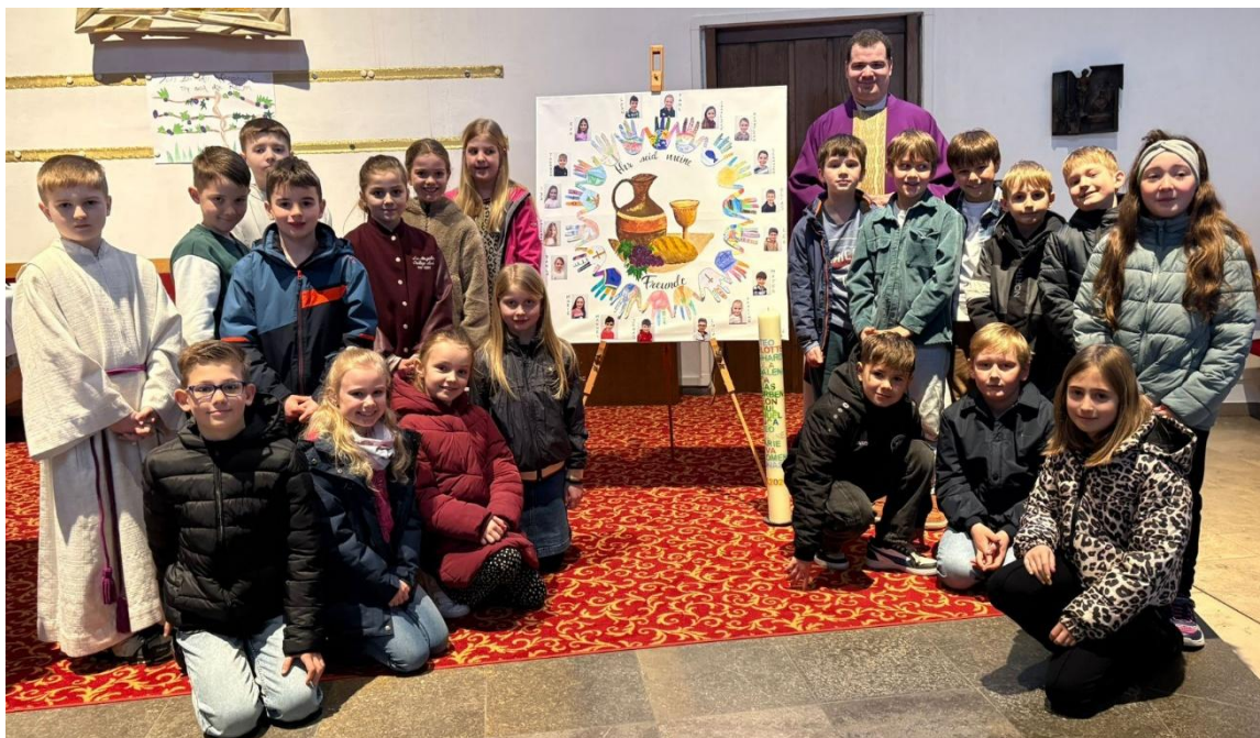
EK - Wilting