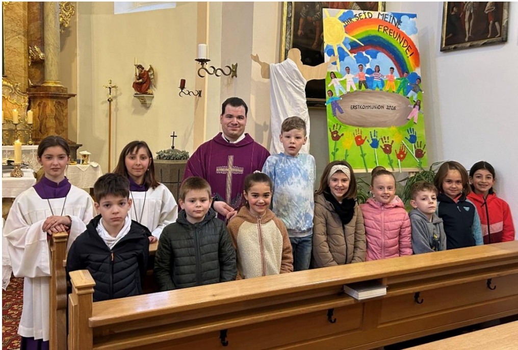
EK - Sattelbogen